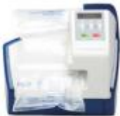
Nützliches von A-Z

Pro-System Verpackungstechnik GmbH Im Kurzgewann 2-4 D-69436 Schönbrunn / Schwanheim