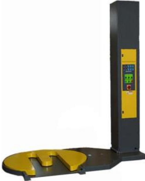
Abb. 90° Ausführung